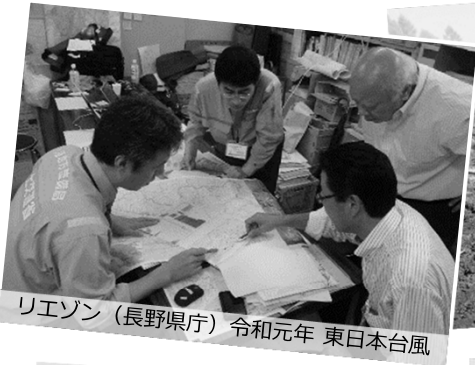
リエゾン（長野県庁）令和元年 東日本台風