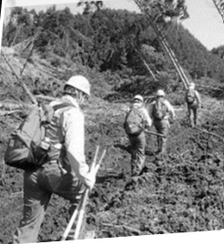
被災状況調査（砂防班） 平成30年 北海道胆振東部地震