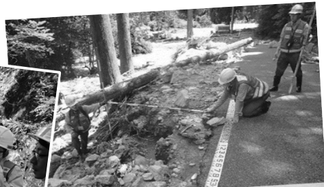
被災状況調査（道路班） 平成30年7月豪雨（広島県東広島市）