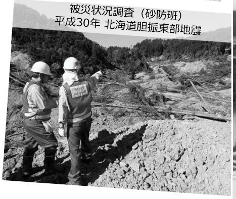
被災状況調査（砂防班） 平成30年 北海道胆振東部地震