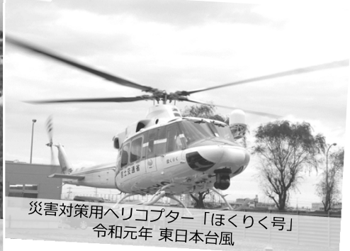
災害対策用ヘリコプター「ほくりく号」 令和元年 東日本台風