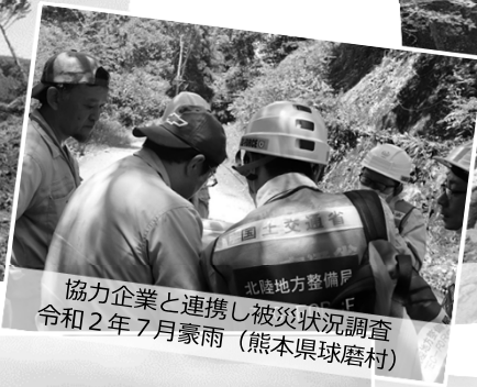
協力企業と連携し被災状況調査 北陸地方整備局 令和2年7月豪雨（熊本県球磨村）