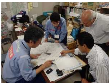
リエゾンによる情報収集と支援メニューの紹介の例