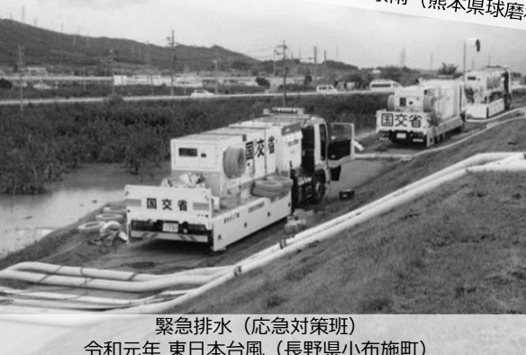
緊急排水（応急対策班） 令和元年 東日本台風（長野県小布施町）