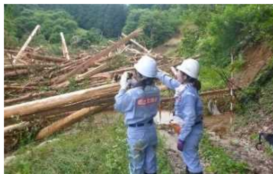
被災状況調査の例